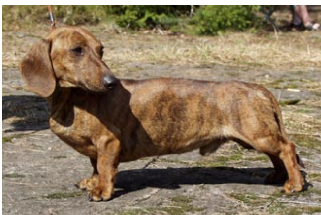
Selvät juovat punaisessa mäyräkoirassa.