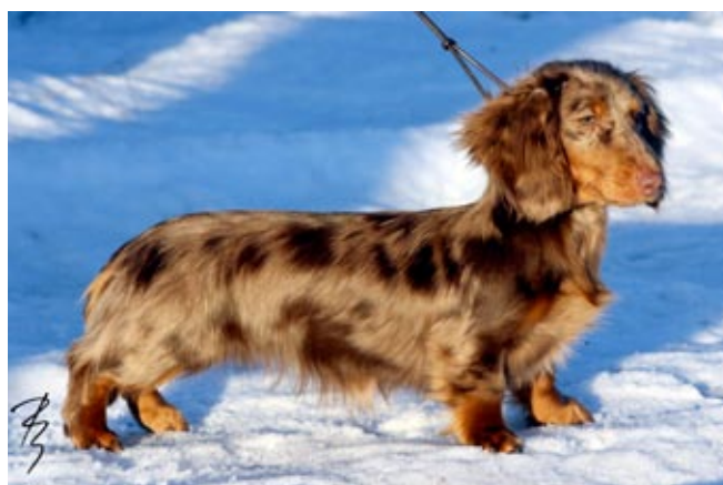
Tasaisesti laikuttunut ruskea keltaisin merkein oleva mäyräkoira.